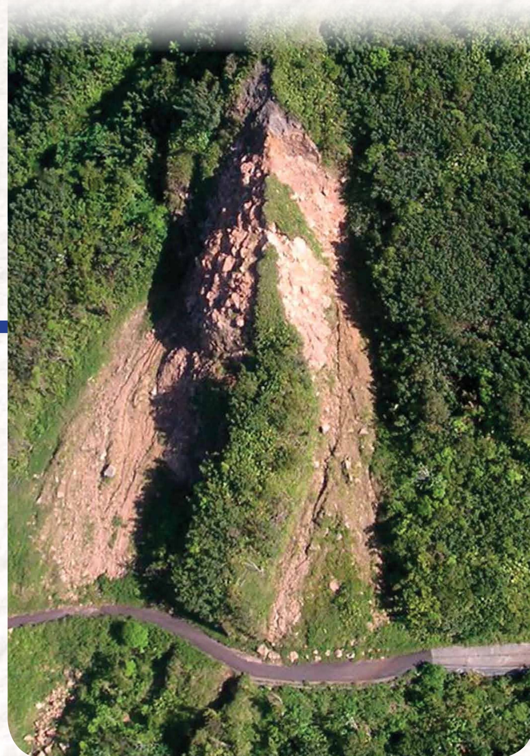
Le Piton Tarade (massif de la Soufrière) marqué par l'éboulement ayant fait suite au séisme des Saintes en 2004

Les aménagements sont très sensibles à ces phénomènes : ils peuvent se fissurer, être entraînés ou s'écrouler.