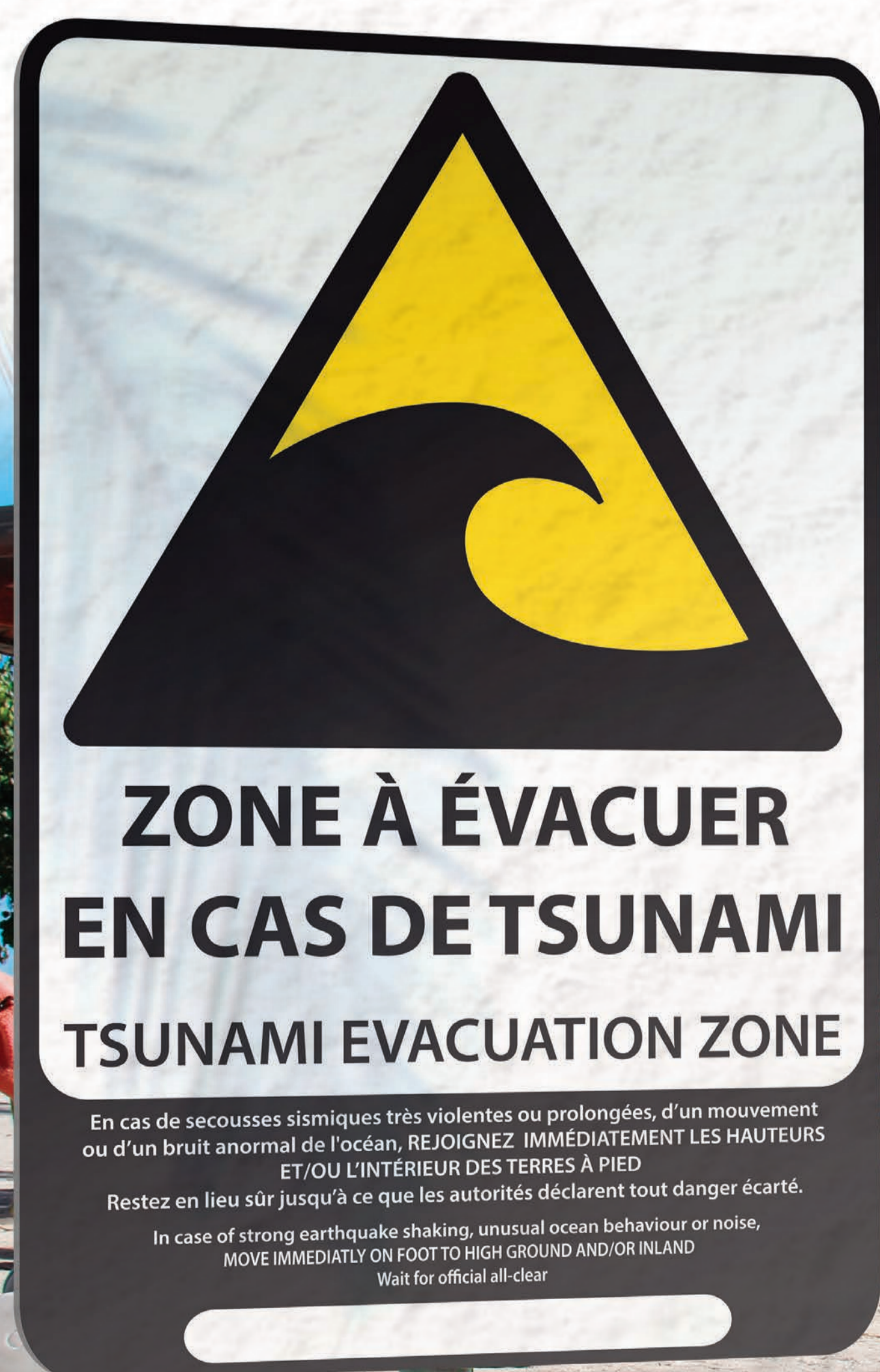
Projet de panneau de prévention au risque tsunami, en cours de mise en place en Guadeloupe

Attendez que les autorités déclarent le danger écarté.