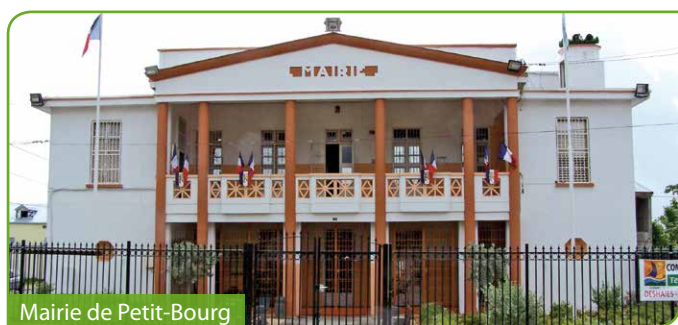
Mairie de Petit-Bourg

Face à ces enjeux climatiques, la commune de Petit-Bourg, ville littorale, bordée par les eaux du Petit Cul-de-Sac Marin, se doit d'anticiper et de préparer son territoire en intégrant des actions adaptées à ses politiques de développement en cours et à venir, afin de réduire sa vulnérabilité.